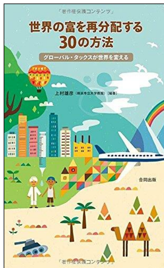
世界の富を再分配する30の方法, 合同出版 (2016/4/4)