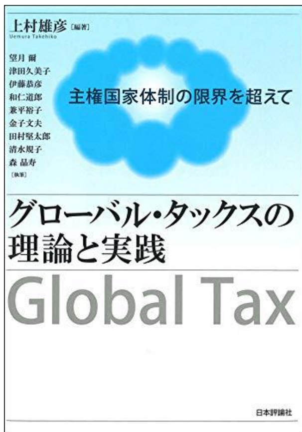
グローバル・タックスの理論と実践 主権国家体制の限界を超えて, 日本評論社 (2019/3/29)

カナダ国際教育局カナダ・日本関係担当官、国連食糧農業機関住民参加・環境担当官、千葉大学大学院人文社会科学研究科准教授などを経て、現職