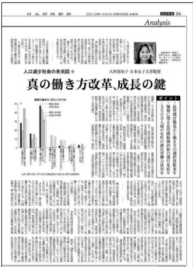
経済教室：人口減少社会の未来図(中) 真の働き方改革、成長の鍵、日本経済新聞 2019年5月29日 朝刊。

■ 略 歴 コロンビア大学社会科学センター研究員、シカゴ大学ヒューレット・フェロー、ミシガン大学ディアボーン校助教授、亜細亜大学助教授・教授を経て、現職。南イリノイ大学経済学部博士課程修了。Ph. D(経済学)。 専門は労働経済学。政府委員／内閣府『仕事と生活の調和連携推進評価部会』委員。内閣府「仕事と生活の調和連携推進評価部会」委員。東京都女性活躍推進会議専門委員等を併任。著書多数。