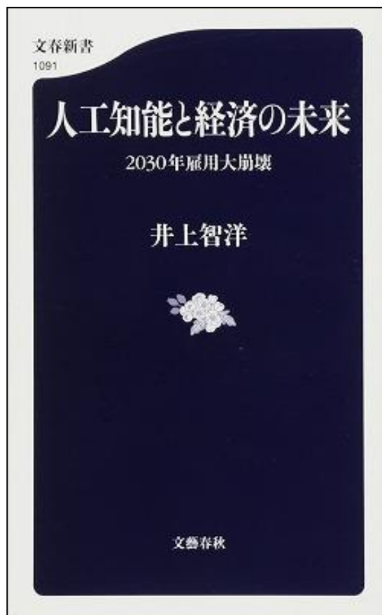
人工知能と経済の未来 2030年雇用大崩壊, 文藝春秋 (2016/7/21)