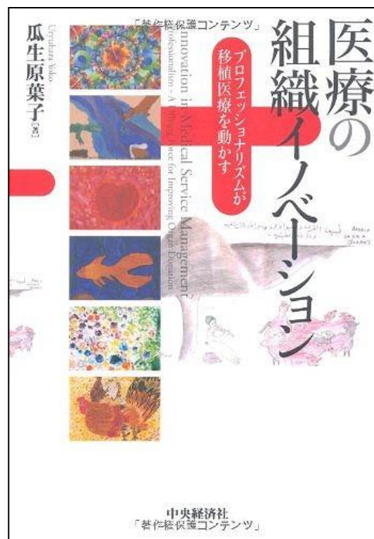
医療の組織イノベーションープロフェッショナルリズムが移植医療を動かす,中央経済社 (2011/12/1)