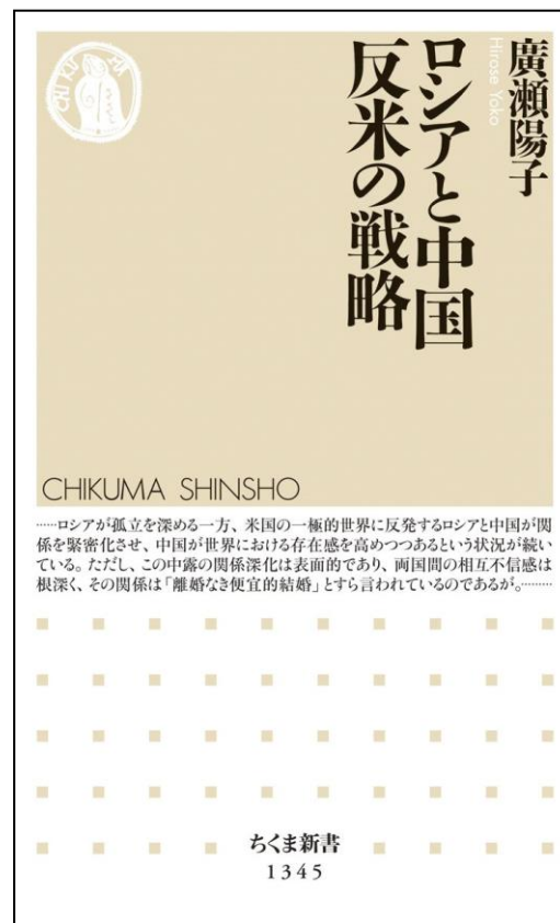
ロシアと中国 反米の戦略, 筑摩書房 (2018/7/6)