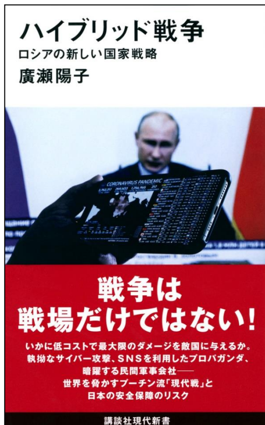
ハイブリッド戦争 ロシアの新しい国家戦略, 講談社 (2021/2/17)

慶應義塾大学総合政策学部卒業。東京大学大学院法学政治学研究科修士課程修了・同博士課程単位取得退学。政策メディア博士(慶應義塾大学)。米国戦略国際問題研究所(CSIS)訪問研究員、国家安全保障局顧問等を歴任。著書には『コーカサス 国際関係の十字路』(集英社新書、アジア・太平洋賞特別賞受賞)、『未承認国家と覇権なき世界』(NHKブックス)など多数。