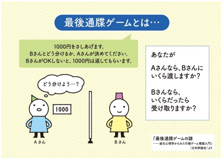
最後通牒ゲームの謎 - 進化心理学からみた行動ゲーム理論入門, 日本評論社 (2021/6/22)