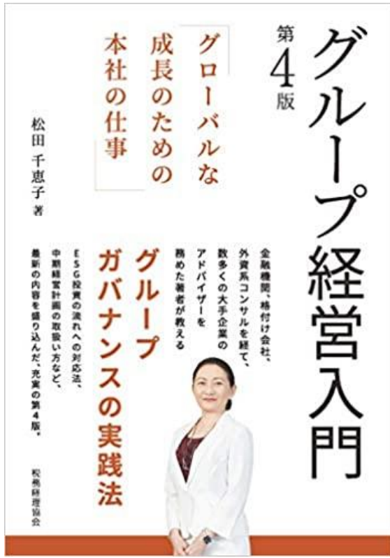
グループ経営入門: グローバルな成長のための 本社の仕事, 税務経理協会 (2019/10/2)