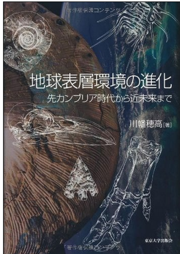
地球表層環境の進化 - 先カンブリア時代から近未来まで, 東京大学出版会 (2011/7/29)