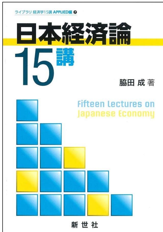
日本経済論15講(ライブラリ経済学15講 APPLIED編 7)、新世社 (2019/1/1)