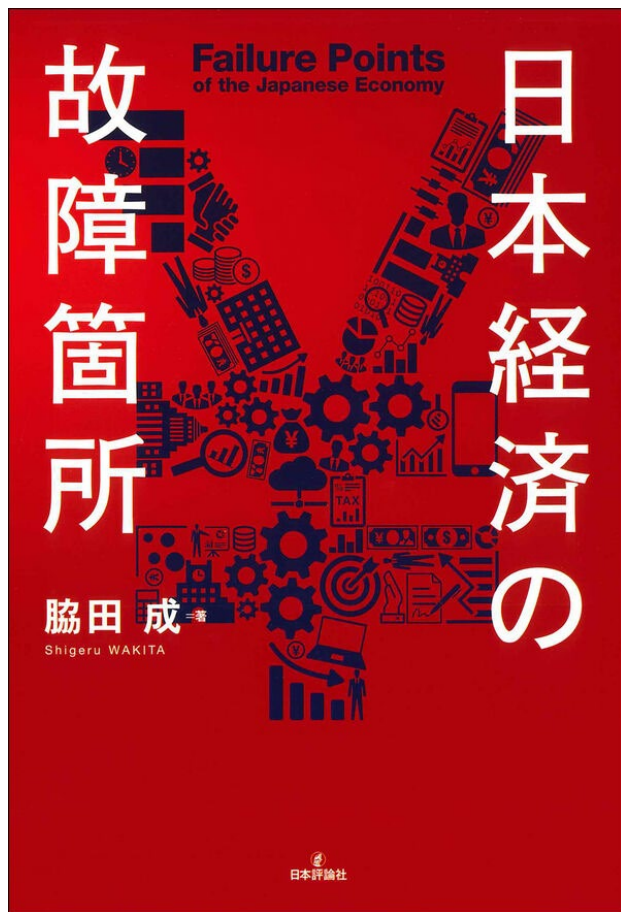
日本経済の故障箇所、日本評論社 (2024/7/2)